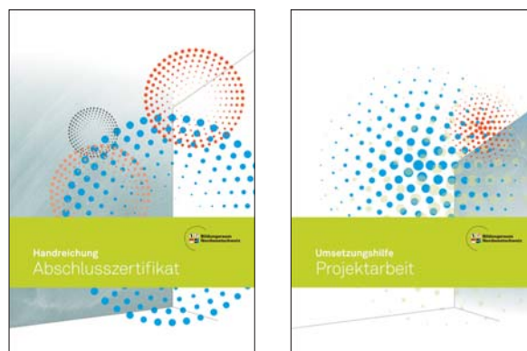
Handreichung Abschlusszertifikat und Umsetzungshilfe Projektarbeit

Für Lehrpersonen und Schulleitungen der Sekundarstufe I 1 bestehen zusätzlich zur Handreichung umfassende Unterstützungsangebote zur Umsetzung des Abschlusszertifikats beziehungsweise der vier Teilzertifikate im Unterricht. Es sind dies die inhaltlichen Referenzrahmen der Checks, die Handreichungen zu den Ergebnismeldungen der Checks, die «Umsetzungshilfe Projektarbeit» inklusive Bewertungsraster und diverser Arbeitsmaterialien wie auch entsprechende Weiterbildungsangebote. Ausführliche Informationen sind zu finden unter www.check-dein-wissen.ch und auf den Internetseiten der vier Kantone des Bildungsraums Nordwestschweiz (siehe Kapitel 4).